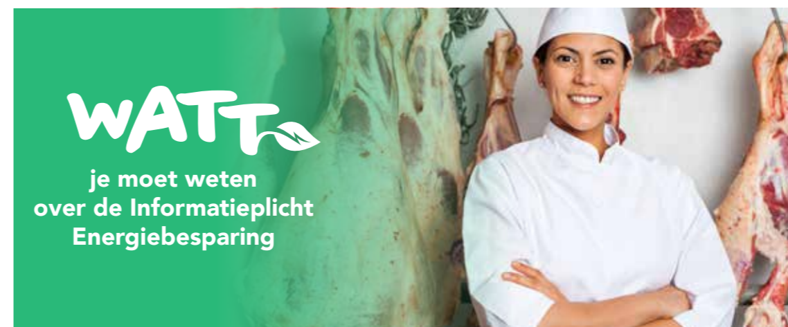
Voorbeelden van branchespecifieke campagnebeelden